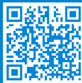
Link zu ausfüllbarem .pdf (Aufnahmeantrag)