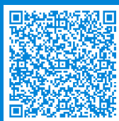
vCard für Mobiltelefon

Ihre Ansprechpartnerin: Martina Mangels Telefon 03 91 / 8 19 55 95 E-Mail info@puppentheaterverein-md.de